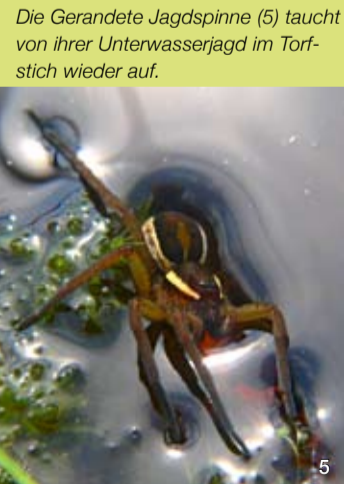
Die Gerandete Jagdspinne (5) taucht von ihrer Unterwasserjagd im Torfstich wieder auf.