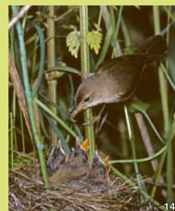
Der Sumpfrohrsänger (14) brütet sowohl in feuchten Staudenfluren und Riedern als auch in reinen Brennnesselfluren. Er nutzt die aufragenden Stängel als Sitzwarte zum Fangen von Insekten und Spinnen.