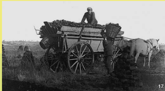
Nach dem vollständigen Trocknen wurden die Soden mit Pferdefuhrwerken abgefahren. Eine „Klote“ passte gerade auf einen Wagen. Für eine Heizperiode waren etwa 10.000 Soden pro Haushalt erforderlich.