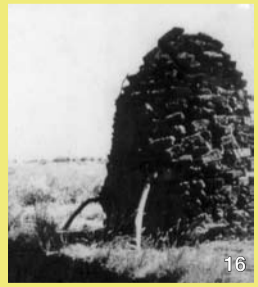
Die am Rande der Pütte aufgestapelten Soden wurden zunächst in kleineren Haufen geringelt (vorne) und danach in großen Diemen („Kloten“) aufgestapelt

Der Schutz und die Wiedervernässung von Mooren hat nicht nur eine Bedeutung für den Arten- und Biotopschutz, sondern ist zugleich aktiver Klimaschutz. Die Maßnahmen tragen dazu bei, unseren Kindern eine lebenswerte Umwelt zu hinterlassen.