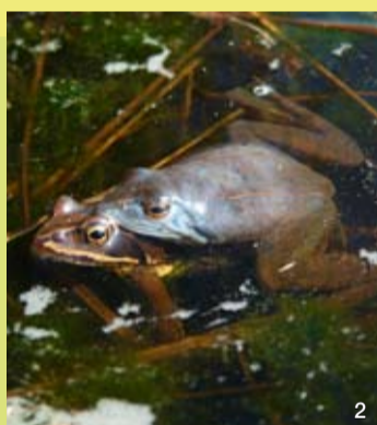
Die Männchen des Moorfrosches (2) sind für wenige Tage zur Laichzeit blau gefärbt.