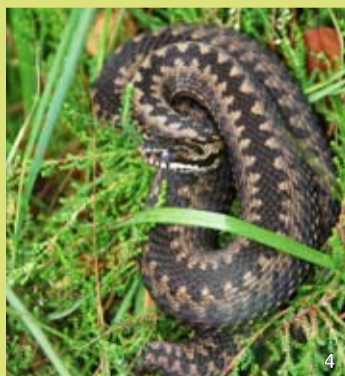
Kreuzottern (4) greifen von sich aus niemals größere Tiere oder Menschen an. Sie beißen nur, wenn sie angegriffen oder getreten werden.