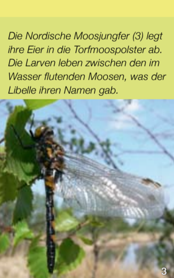
Die Nordische Moosjungfer (3) legt ihre Eier in die Torfmoospolster ab. Die Larven leben zwischen den im Wasser flutenden Moosen, was der Libelle ihren Namen gab.

Teilentwässerte Hochmoore und andere Feuchtgebiete wie Niedermoore haben heute eine zunehmende Bedeutung als Ersatzlebensraum für Tierarten, die aufgrund der intensiven Nutzung und Entwässerung aus der modernen Kulturlandschaft verdrängt werden. Neben Moorfrosch, Kreuzotter, Nordischer Moosjungfer und Gerandeter Jagdspinne finden im Hartshoper Moor besonders viele Vogelarten geeignete Lebensbedingungen und ungestörte Rückzugsgebiete.