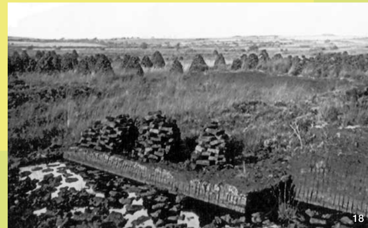
Typische Moorlandschaft in der Eider-Treene-Sorge Niederung um 1920. Die ausgestochenen Soden trocknen in Mieten.

Von den Mitgliedern des Runden Tisches wiederholt durchgeführte, räumlich eng begrenzte Entbirkungsaktionen erhalten den offenen Charakter der Moorflächen.