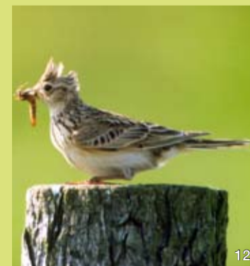
Auch die Feldlerche (12) ist ein Bodenbrüter. Ihre Jungen füttert sie mit Insekten, einer energiereichen Eiweißnahrung.