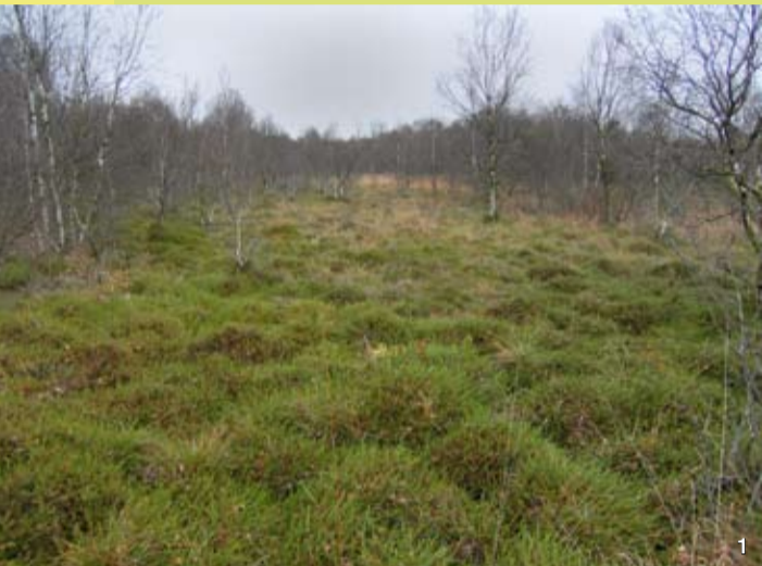
Mit Zwergsträuchern und Birken bestandene Hochmoorfläche

Redaktion, Grafik und Herstellung Planungsbüro Mordhorst-Bretschneider GmbH, Kolberger Straße 25, 24589 Nortorf Tel: 04392 / 69271, www.buero-mordhorst.de