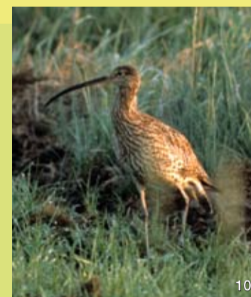
Der Große Brachvogel (10) ist durch seinen langen gebogenen Schnabel unverkennbar. Im Frühjahr klingt sein wehmütig flötender Ruf über die Moorflächen.