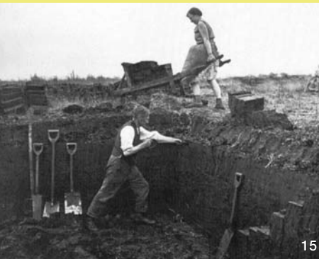
Bei der Brennortfegewinnung löste man mit verschiedenen Torfspaten und Torfstechern („Steker“) die über ziegelsteingroßen Torfsoden von der Bank ab.

Bis ins späte Mittelalter hinein wurden Moorgebiete meist nur in den Randbereichen landwirtschaftlich genutzt. Zwischen 1760 und 1765 wurde in Schleswig-Holstein und Jütland die Kolonisierung der riesigen ungenutzten Moorflächen systematisch vorangetrieben. Ziel war, dem dänischen König neue Einnahmequellen zu erschließen und die Unabhängigkeit von anderen Staaten zu vergrößern. Die in den Mooren und Heiden angesiedelten Bauern kamen aus Süddeutschland. Zumeist waren es vorher sehr arme, einfache Knechte und Mägde, die sich mit der Aussicht auf eigenes Eigentum und Befreiung von Steuern und Militärdienst locken ließen. Ihr neues Leben erwies sich jedoch als außerordentlich hart. Trotz staatlicher Zulagen gaben viele Kolonisten ihre Höfe bald wieder auf. Der Spruch „Den Ersten sien Dod, den Tweeten sien Not, den Drütten sien Brod“ (Dem Ersten der Tod, dem Zweiten die Not und dem Dritten das Brot) traf wie in allen Siedlungsgebieten hier besonders zu.